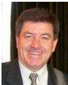
Guy Ryder, secrétaire général de la CSI